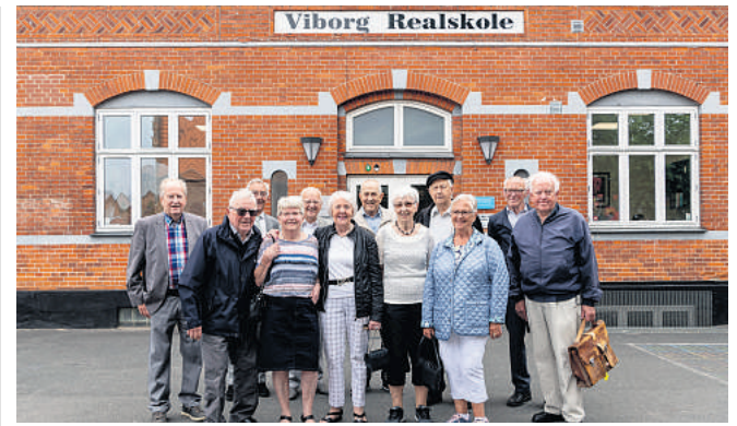
65-års jubilare fra den tidligere Føns' Skole mødtes på Viborg Private Realskole, som skolen hedder i dag.

Fødselsdagen markeres ved en privat fest for familien og de nærmeste venner.